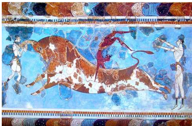
Juegos del toro